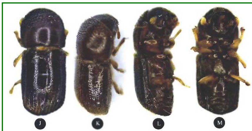
Figura 5. Adulto: vistas dorsal, lateral y ventral respectivamente

Es polífago, se alimenta de varias plantas, emergen de forma sincronizada con la nueva salida de hojas. Su longevidad es de aproximadamente 42 días. (Figuras 3, 4, 5 y 6)