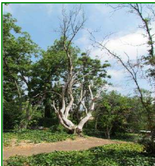
Figura 1. Árbol muerto

Su importancia radica en que va asociado al hongo de la marchitez del aguacate por Fusarium sp. y por lo tanto se comporta como un vector de transmisión. Al final, esta enfermedad provoca la muerte del árbol (Figura 1).