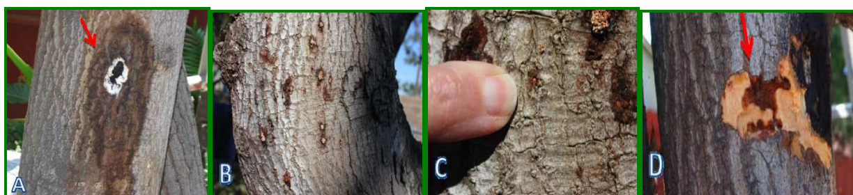
Figura 12. Daños

Los síntomas de marchitez de Fusarium sp. son un exudado de polvo blanco seco o húmedo rodeado por decoloración de la corteza externa en asociación con un agujero y la única salida del escarabajo (Figura 11). Aunque no hay heridas visibles a la corteza en esta etapa de la colonización, cuando se hace un examen de ésta y a la madera bajo el punto infestado y perforado por el escarabajo, se revela decolorada de color marrón y la muerte causada por el hongo (Figura 12-D).