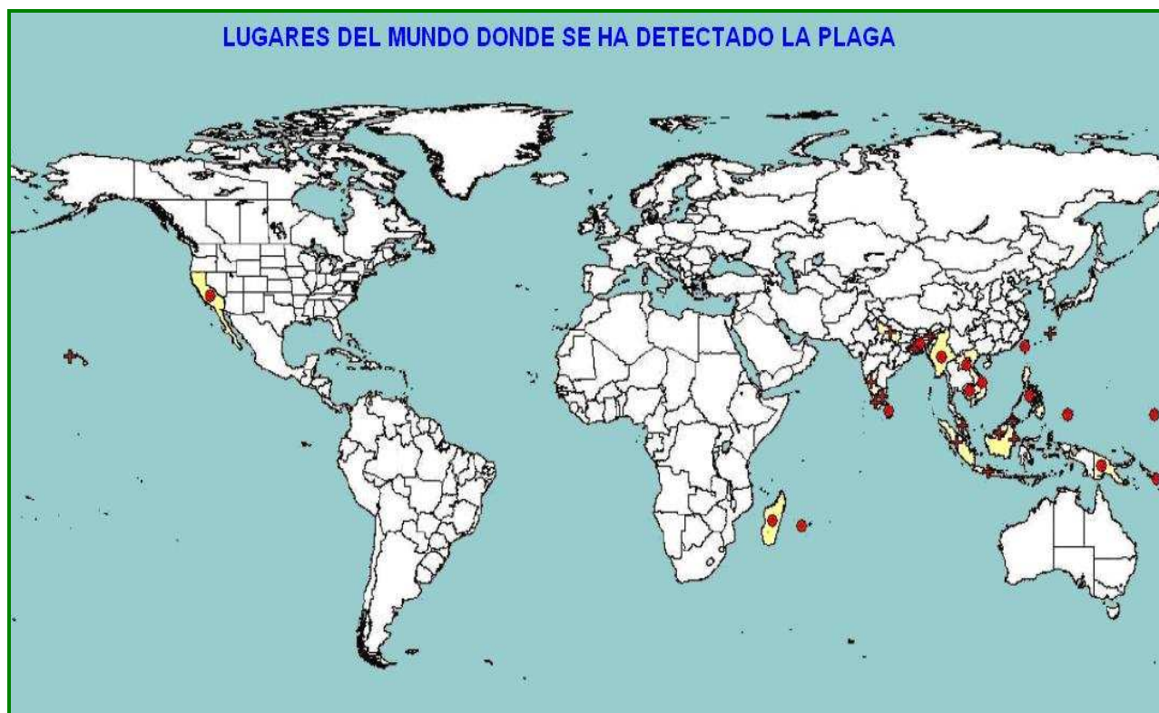
Figura 2. Distribución en el mundo. EPPO. Consulta el 22/01/2013. Nota; no aparece el foco de Israel.