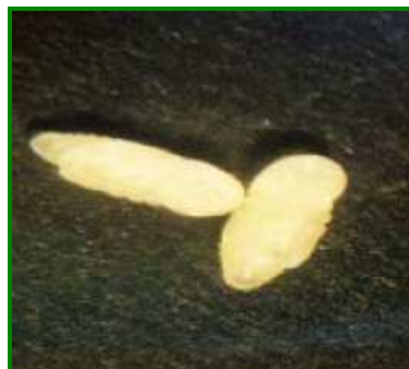
Figura 7 y 8. Huevos