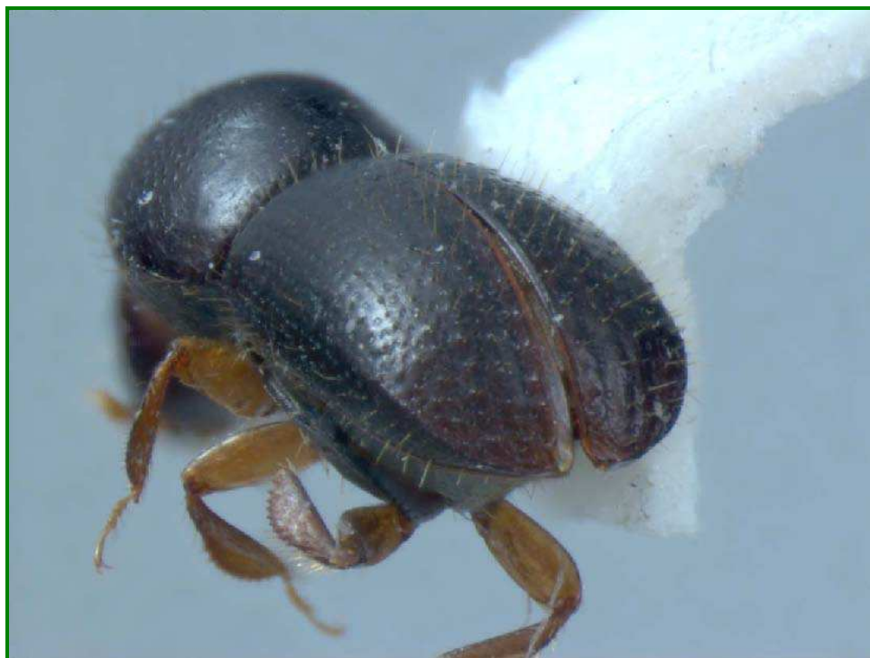
Figura 6. Adulto