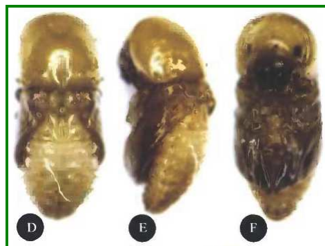
Figura 10. Pupa: vistas dorsal, lateral y ventral, respectivamente.

Las larvas pupan dentro de las galería de pequeñas ramas. Son de color marrón amarillento y miden 1,97 x 0,97. El periodo de permanencia en estado de pupa es de 10 días. (Figura 10)