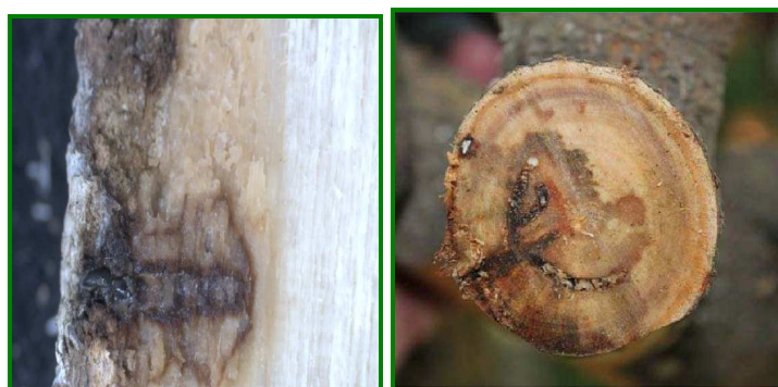
Figura 11. Entrada del escarabajo en la madera

Los síntomas de marchitez de Fusarium sp. son un exudado de polvo blanco seco o húmedo rodeado por decoloración de la corteza externa en asociación con un agujero y la única salida del escarabajo (Figura 11). Aunque no hay heridas visibles a la corteza en esta etapa de la colonización, cuando se hace un examen de ésta y a la madera bajo el punto infestado y perforado por el escarabajo, se revela decolorada de color marrón y la muerte causada por el hongo (Figura 12-D).