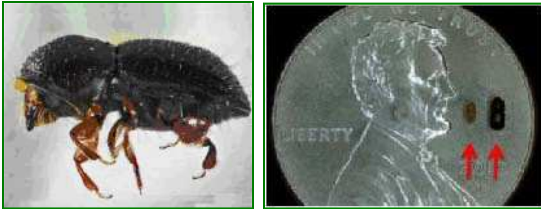
Figura 3 y 4. Adulto. Tamaño del insecto.

Es un escarabajo muy pequeño y difícil del ver (Figura 2). Las hembras son de color negro y sobre 1'8 a 2'5 mm de largo (Figura 2). Los machos son de color marrón y aproximadamente de 1'5 mm de largo. El agujero de salida en los árboles de aguacate es de aproximadamente 0'85 mm. El ciclo completo se desarrolla en 4 fases: Huevo, larva, pupa y adulto.