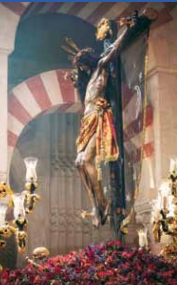
Stmo. Cristo del Remedio de Ánimas Anónimo / Siglo XVII