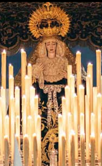
María Stma. de Gracia y Amparo Anónimo / Siglo XVIII