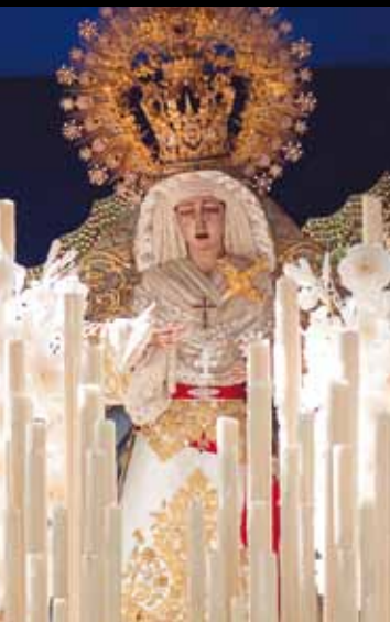
Nuestra Señora de la Estrella Juan Ventura / 1986