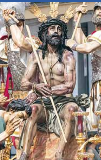
Ntro. P. Jesús Humilde en la Coronación de Espinas Francisco Buiza Fernández / 1978