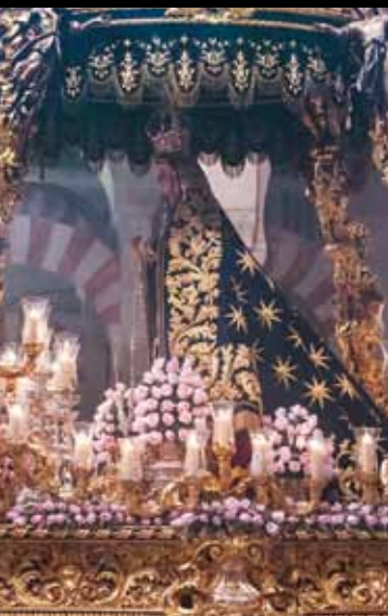
Ntra. Sra. M. de Dios en sus Tristezas Anónimo / Siglo XVII